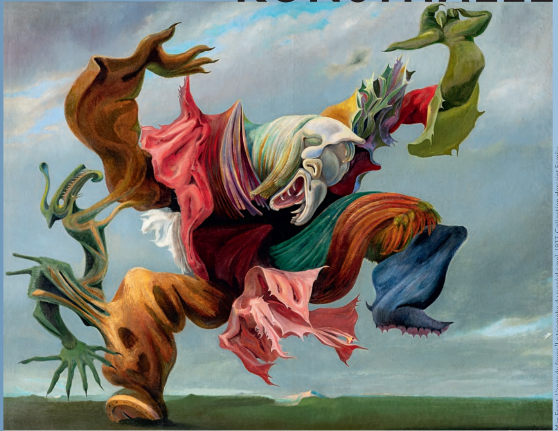
Max Ernst: Lange du foyer (Le triompho du surréalisme), 1937, Collection Hersaint Family, © Vincent Everaerts Photography, Brussels, © VG Bild-Kunst, Bonn 2024