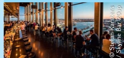
© Stefan Karstens / Skyline Bar 20up

Köstliche Drinks und einen atemberaubenden Blick genießen Sie in der Skyline Bar 20up im Empire Riverside Hotel, der Puzzle Bar im 15. Stock des Campus Towers, der Wein- und Ginbar TWOSIX auf dem Dach des Radisson Blu und der Top Seven Roof Bar im Grand Elysée.