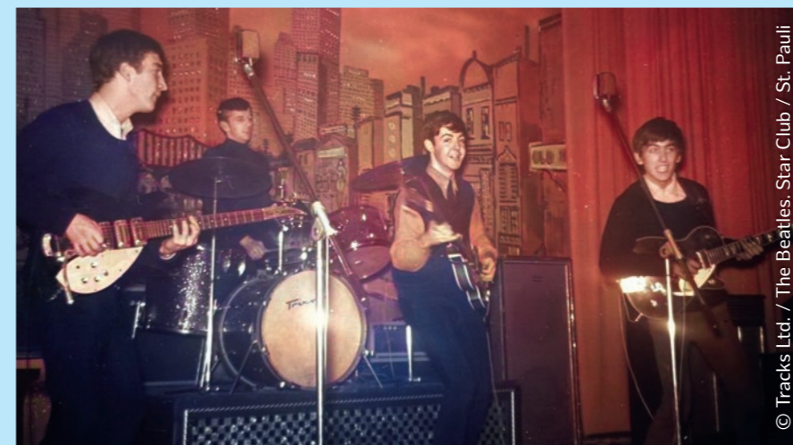
© Tracks Ltd. / The Beatles, Star Club / St. Pauli

der Clubplan-App (Download in den jeweiligen App-Stores). Auch Festival-Fans kommen auf ihre Kosten: Ob das Reeperbahn Festival , welches eines der größten Clubfestivals Europas ist, das ELBJAZZ im Hamburger Hafen oder auch das allsommerliche Spielbudenfestival , welches neben Musik auch Straßenkunst und -theater bietet – hier schlägt jedes Livemusikherz höher.