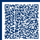
Mehr zu Hamburgs Theatern

Hamburgs Theaterlandschaft ist hochkarätig, vielfältig und preisgekrönt. So wurde beispielsweise das Deutsche Schauspielhaus (Bild rechts) in diesem Jahr zum „Theater des Jahres 2024“ gewählt. Sehenswert sind natürlich auch die „Typisch Hamburg“-Bühnen wie das Ohnsorg Theater mit seinen Stücken „ob Platt“, die Stars auf der Reeperbahn im St. Pauli Theater oder im Schmidt Theater . Und auch die zahlreichen kleineren Bühnen wie die Hamburger Kammerspiele oder das MUT! Theater bringen wundervolle Unterhaltung auf die Bretter. Egal ob Sprech-, Musik- oder Tanztheater – die Hamburger Bühnen zählen zu den renommiertesten und facettenreichsten in ganz Deutschland.