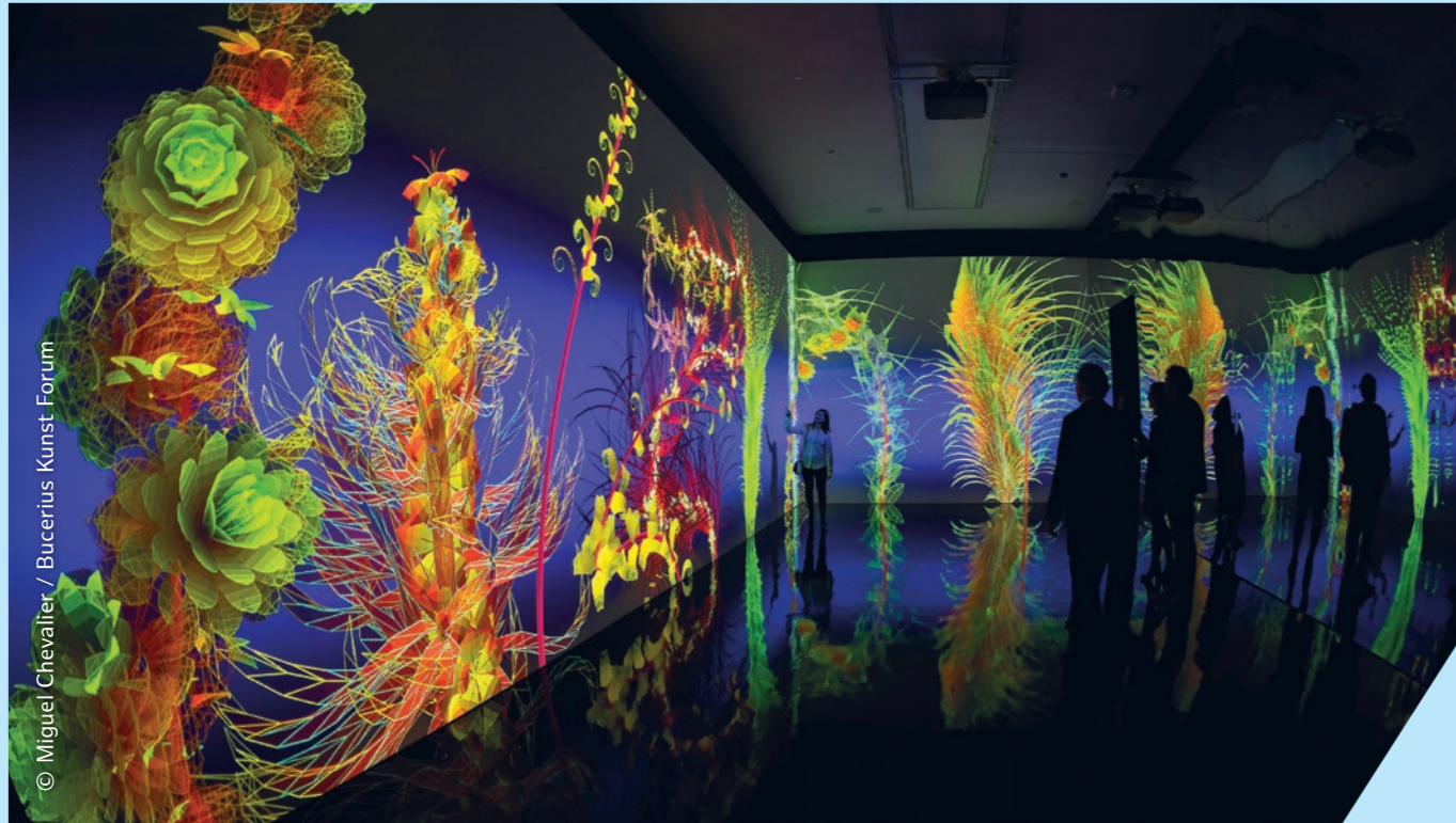
© Miguel Chevalier / Bucerius Kunst Forum