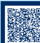
Mehr zu Hamburgs Clubkultur

Hamburg ist die Stadt der Newcomer: Bereits 1960 hatten die Beatles in den Clubs auf St. Pauli ihre ersten Auftritte und starteten von hier aus ihre Weltkarriere. Bis heute hat sich die Hamburger Musikszene diese Offenheit für Neues bewahrt. Ob in Konzertsälen, Clubs und Bars oder unter freiem Himmel – Hamburg bringt immer neue Künstlerinnen und Künstler auf die Bühne.