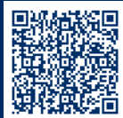
Mehr zu Hamburgs Kulinarik

Ob Fischbrötchen oder 5-Gänge-Menü, Labskaus oder Austern, Craftbeer oder Champagner – die Hansestadt bietet praktisch überall kulinarische Entdeckungen ganz nach persönlichem Geschmack. Heute ein Snack auf die Hand und morgen nachhaltige Sterneküche – so ist Hamburg. „Foodies“ genießen hier sinnliche Kochkunst und haben auch in Sachen Nachhaltigkeit die Wahl.